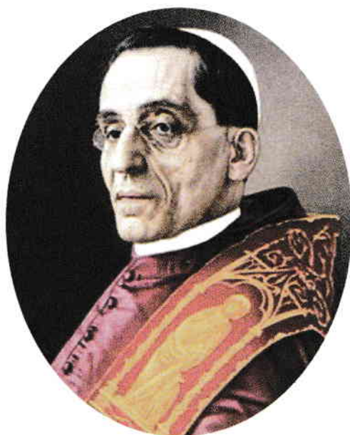
Papa Benedict al XV-lea, 1914-1922

S-a preocupat în permanență de bunăstarea materială a Bisericii, a clerului și credincioșilor săi, a avut grijă de săracii de pe teritoriul eparhiei.