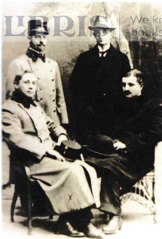
Preot militar, împreună cu câțiva colegi