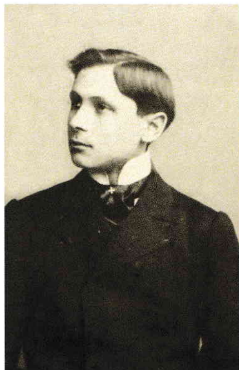
Absolvent al Gimnaziului Superior Greco-Catolic din Blaj, promoția 1903-1904

1910 – la 18 iunie dobândește și titlul de doctor în „sfânta teologie”