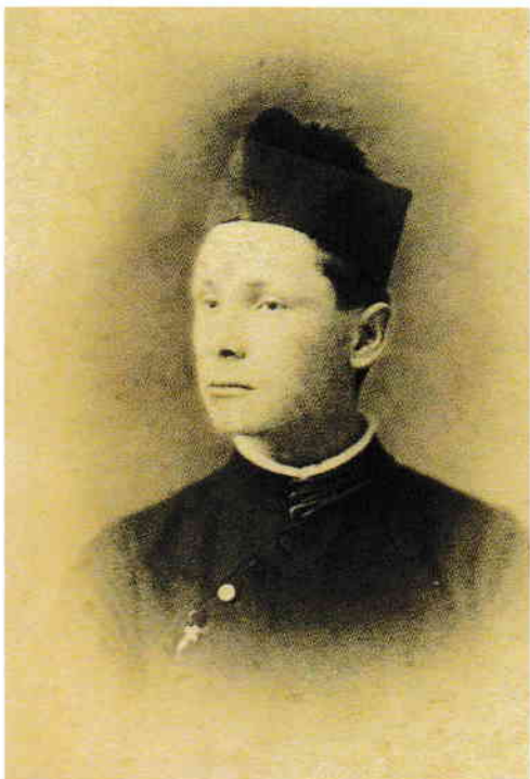
Roma, 28 iunie 1908