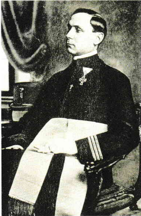
Episcop de Gherla-Armenopoli, 1917

În 1912 a luat ființă, la Gherla, „Uniunea misionară a clerului” și s-a înființat „Reuniunea de misiuni sfinte”. În centrul eparhial se țineau periodic exerciții spirituale pentru preoți.