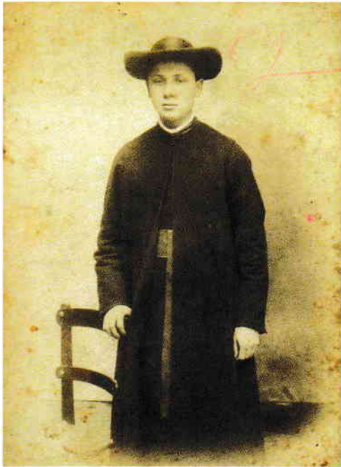
Student la Institutul „De Propaganda Fide”, Roma